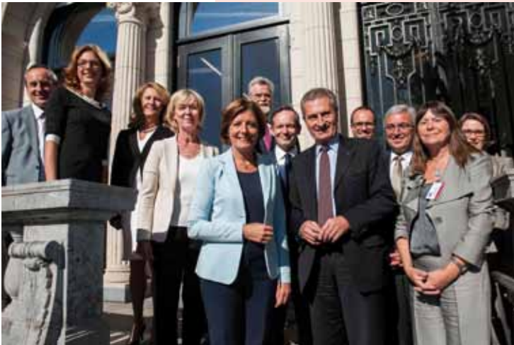
Der rheinland-pfälzische Ministerrat mit EU-Kommissar Günther Oettinger bei einem Treffen in der Landesvertretung Rheinland-Pfalz in Brüssel.

rahmen für die Europäischen Union für die Jahre nach 2020, die Zukunft der wichtigen europäischen Programme, von denen das Land profitiert, wie z.B. EFRE, ELER, ESF und Interreg, aber auch die Direktzahlungen in der Landwirtschaft sowie Direktprogramme im Bereich der Forschung wie Horizon 2020 oder der Bildung wie Erasmus+. Daneben bündelt der Plan diverse fachpolitische Anliegen, beispielsweise in den Bereichen europäische Steuerpolitik, Digitalisierung, aber auch Katastrophenschutz.